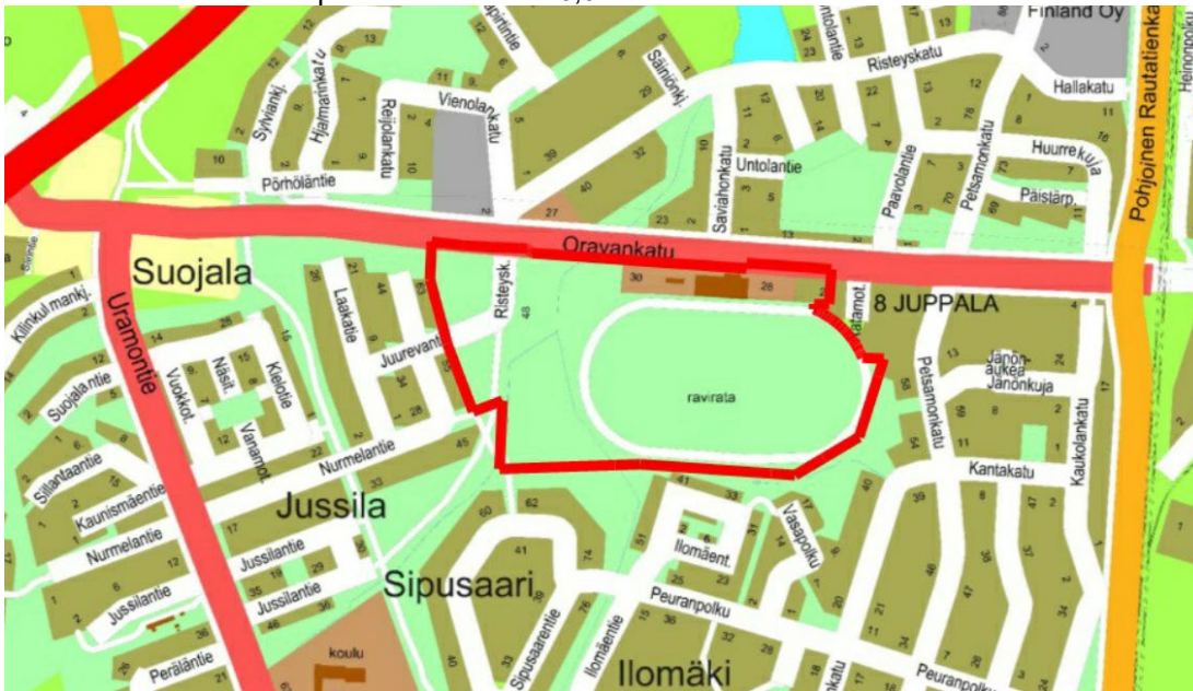
Suunnittelualueen likimääräinen sijainti on merkitty punaisella rajauksella.

Suunnittelualue sijaitsee Juppalan kaupunginosassa, noin kaksi kilometriä rautatieasemasta pohjoiseen, Oravankadun eteläpuolella. Suunnittelualue käsittää idässä Riihimäen raviradan ympäristöineen ja lännessä puoliavoimen, nurmivaltaisen virkistysalueen. Koko alue on varsin tasainen. Alueen luoteis-, länsi- ja eteläosissa kulkee avo-ojia. Ravirata-alueita reunustaa paikoin matalat maavallit sekä katokset. Suunnittelualue rajautuu idässä ja lännessä pientaloasutukseen. Pohjoisessa aluetta rajaa Oravankatu ja etelässä virkistysalue. Suunnittelualueen pinta-ala on noin 16,9 ha.