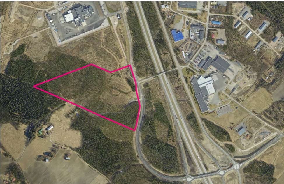
Kaava-alueen likimääräinen sijainti ilmakuvassa punaisella rajauksella.

Suunnittelualue sijaitsee Riihimäen keskustan ja valtatie 3 lounaispuolella, noin 5 kilometriä rautatieasemasta lounaaseen, Herajoen läntisellä teollisuusalueella, Meijerintien varrella. Alustava suunnittelualue käsittää Riihimäen kaupungin omistuksessa olevan noin 15 ha suuruisen maa-alueen, joka koostuu neljästä eri tilasta sekä Meijerintien katualueesta. Alue on rakentamatonta, pääosin metsävaltaista, rinteistä moreeni-maastoa. Alueen koillisosassa on avoimempi, tasainen, savipohjainen alue. Suunnittelualue rajautuu pohjoisessa Valion välipalatehtaan tonttiin, idässä Meijerintiehen ja lounaassa Retkiojantiehen, joka myös osittain halkoo suunnittelualueetta sen kaakkoisosassa.